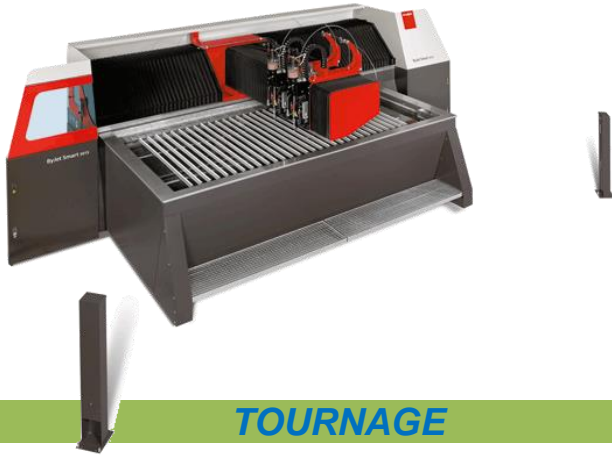
BYSTRONIC ByJet Smart 1350